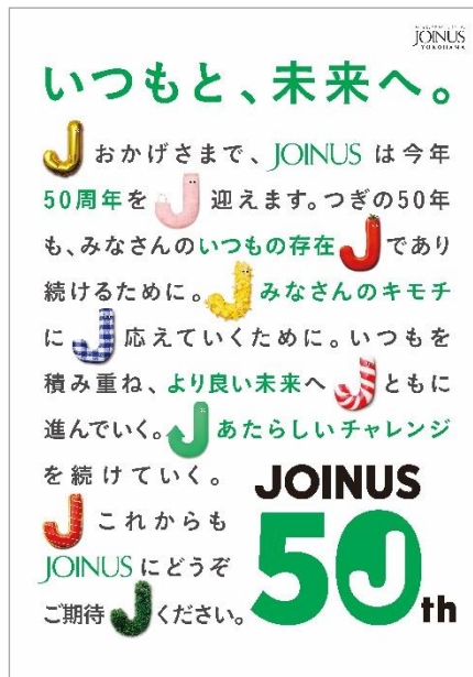
メッセージポスター(右)

横浜駅西口直結のショッピングセンター「ジョイナス」は、11月20日で開業 50 周年を迎えます。長きにわたりジョイナスをご愛顧いただいている皆さまへ感謝の気持ちを込めて、地域のお客さまと一緒に、50 周年を盛り上げてまいります。