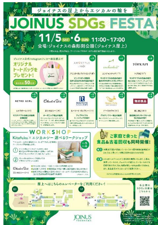
「JOINUS SDGs FESTA」ポスター